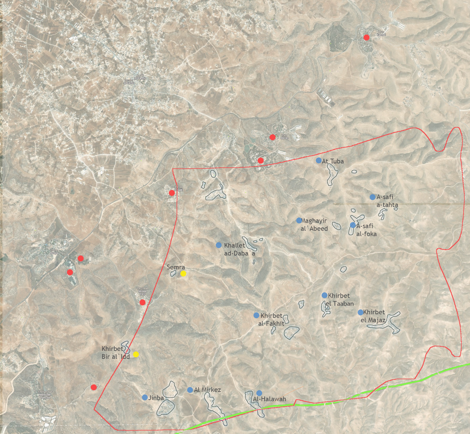
● קהילות ● כפרים נטושים ● התנחלויות ישראליות — שטח אש 918 — הקו הירוק (גבול 67)